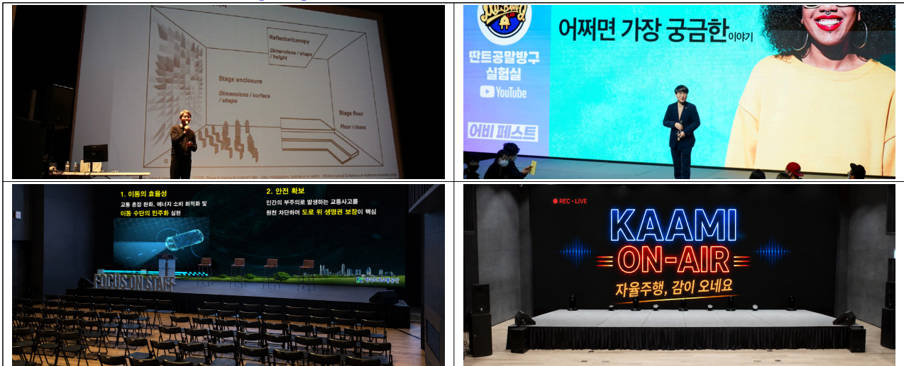
[참고] 자율주행 KAAMI ON-AIR 세미나 예시